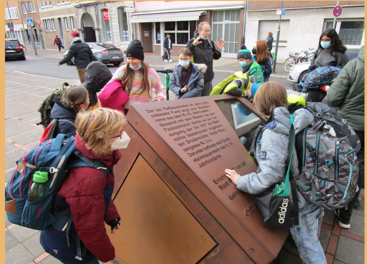
11- Fenster: Steinrinne (Klappergasse)