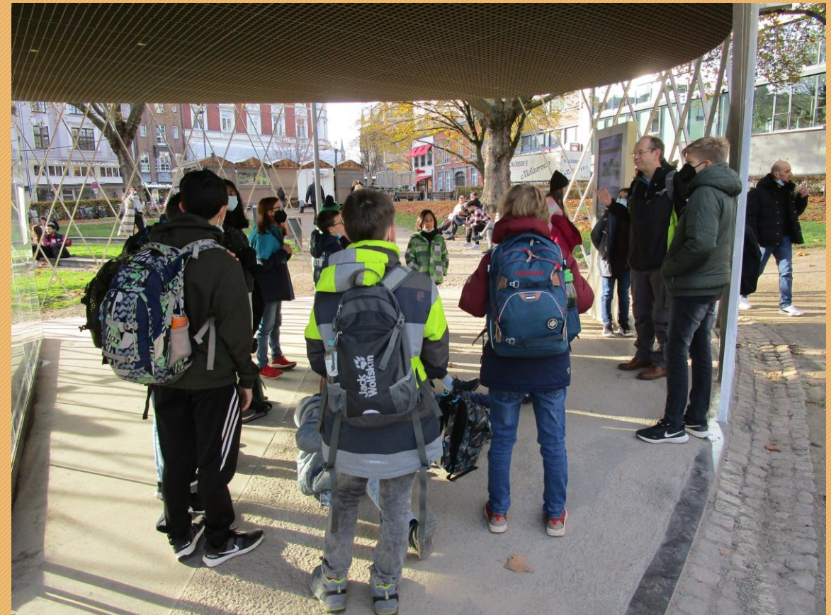
1 - Archäologische Vitrine (Elisengarten)