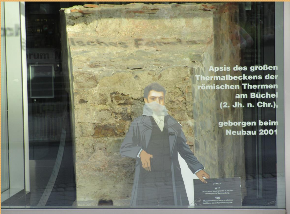
3- Mayersche Buchhandlung (Buchkremmerstraße)

Das Schulprogramm der Deutschen Stiftung Denkmalschutz