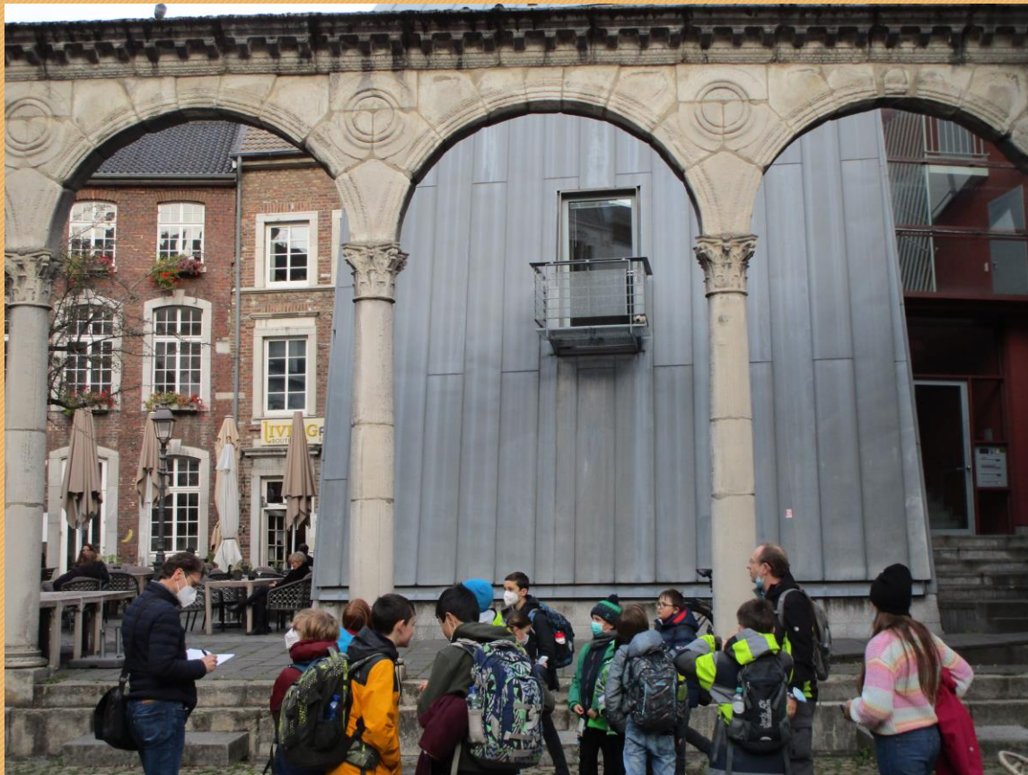
13 - Portikus-Replik, Forum, Tempel (Hof)

Das Schulprogramm der Deutschen Stiftung Denkmalschutz